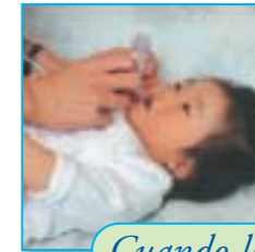
Cuando llegue a casa: