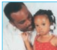
Durante las vacunas: