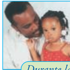
Durante las vacunas: