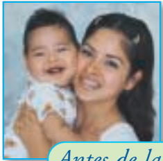
Antes de las vacunas: