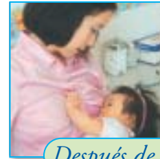
Después de las vacunas: