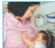
Después de las vacunas: