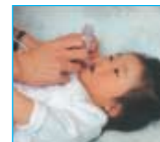
Cuando llegue a casa: