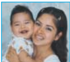
Antes de las vacunas: